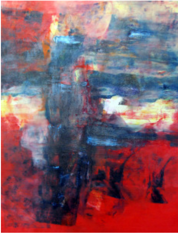
Öl auf Leinwand 80*100 - 06/02/03