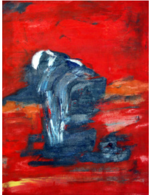
Öl auf Leinwand 40*50 - 06/04/03