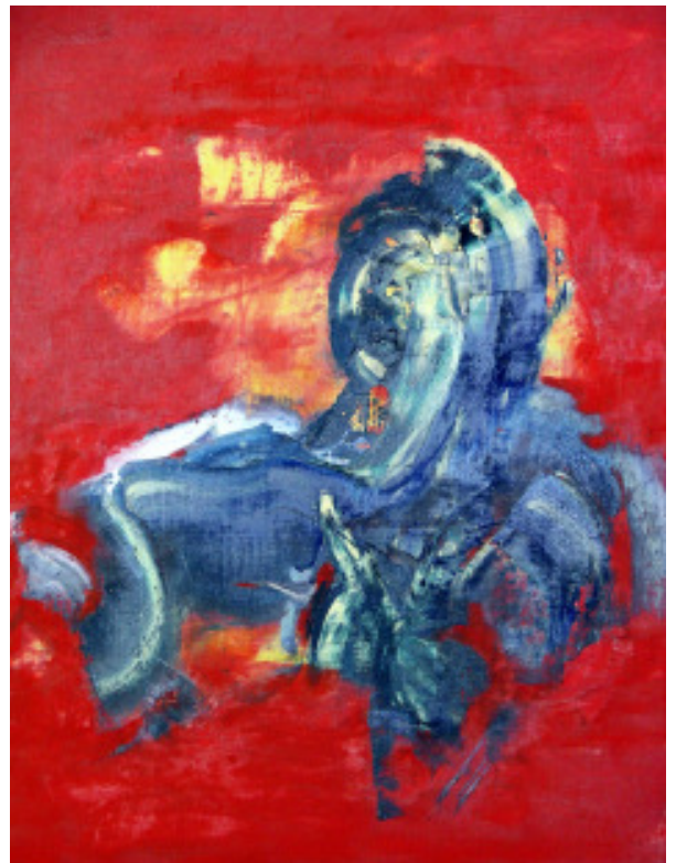
Öl auf Leinwand 40*50 - 06/04/04