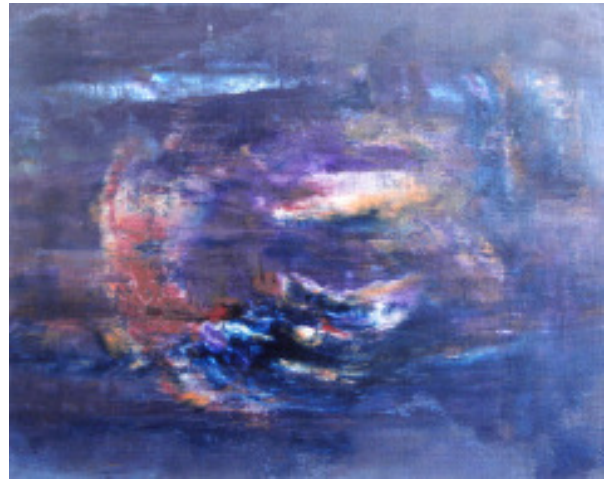
Öl auf Leinwand 40 * 50 - 06/04/16