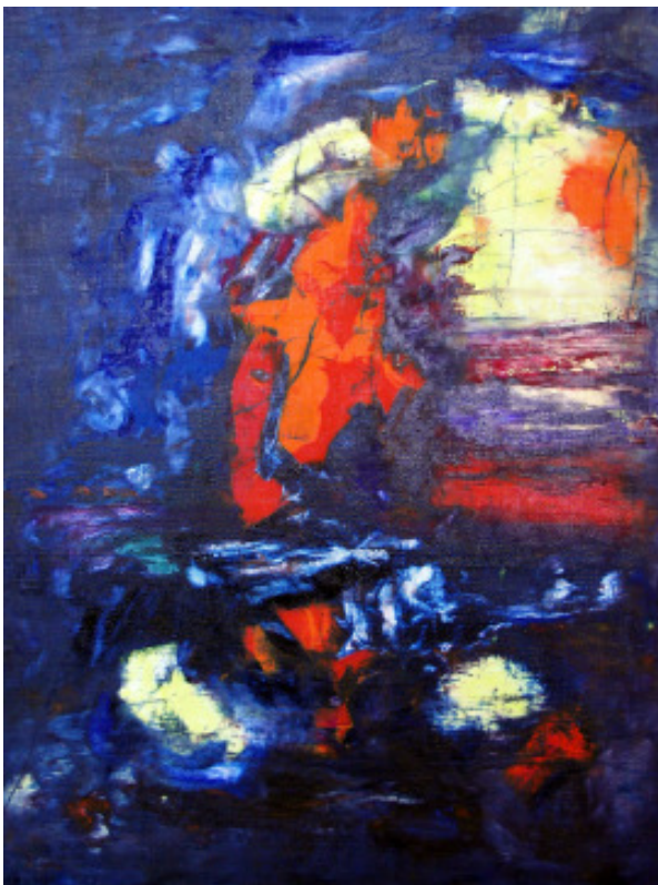
Öl auf Leinwand 60*80 - 06/03/05